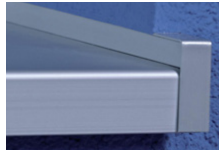
Putzbündig eingebauter Fensterbank-Gleitabschluss A 900 G

Kombinierbar mit allen BUG Fensterbänken und dem schlagregendichten BUG Fensterbank-Stoßverbinder H500D sowie dem Innen- und Außeneckverbinder I500D90/135 und A500D90/135.