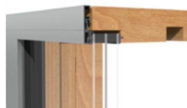
Detailschnitt der „HST“