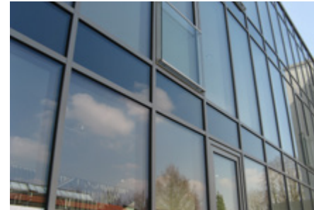
BUG Holz-Aluminium-System „Fassade 50“