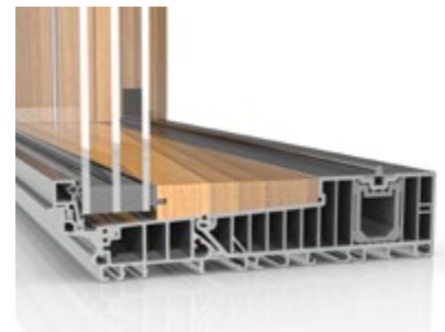
Seitenschnitt mit Verglasung der Hebe-Schiebe-Tür „HST“