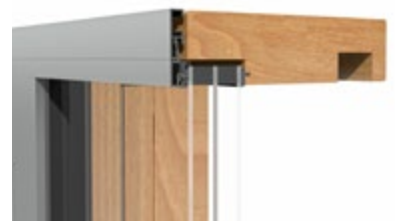
Detailschnitt der „HST“