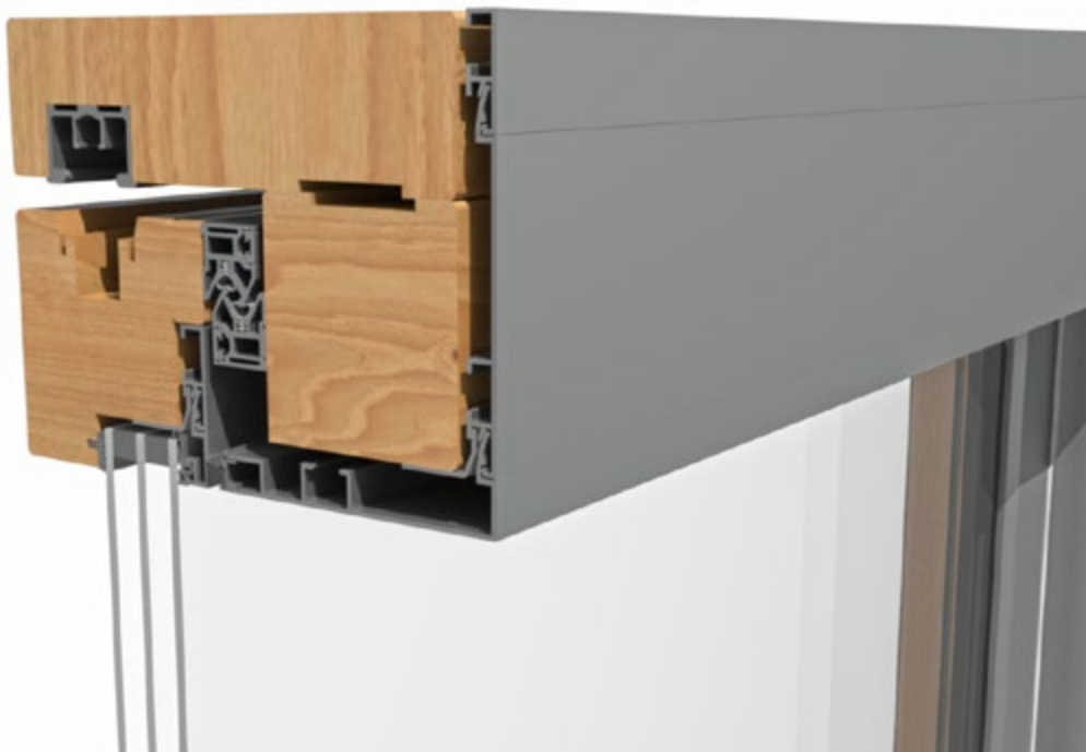
Detailschnitt der BUG Hebe-Schiebe-Tür „HST“ mit außen montierter 3-fach Verglasung