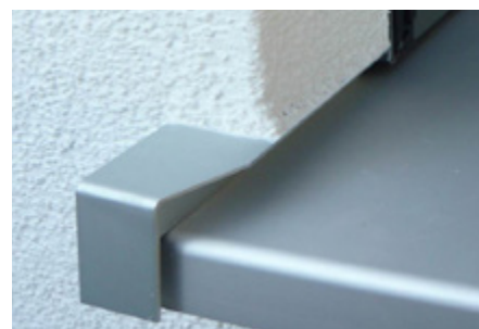
A 500 V/34 mit Führungsschiene

Der entkoppelte BUG Fensterbank-Gleitabschluss A 500 V ist ebenfalls in der Ausführung als A 500 V/24 mit 24 mm Putzträger erhältlich.